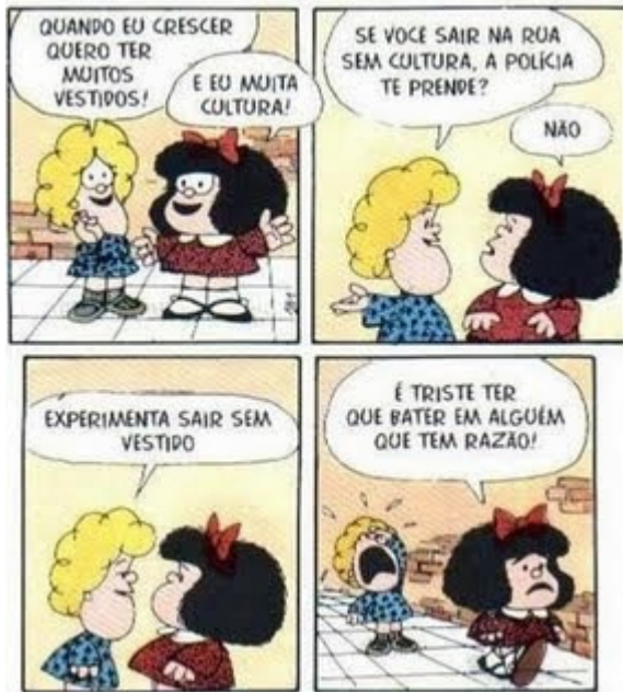
(Quino, Toda Mafalda)

Utilize a tirinha abaixo para responder aos testes 23 e 24.